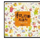
和の行事えほん あすなる書房