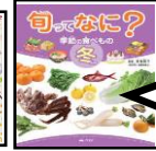
旬ってなに? 汐文社