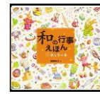
和の行事えほん あすなろ書房