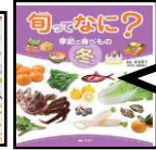
旬ってなに? 汐文社