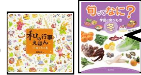
和の行事えほん あすなる書房 旬ってなに? 汐文社