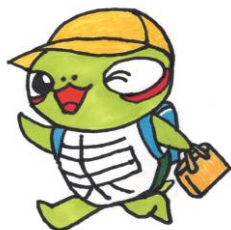
東原小学校キャラクター 「かめっち」