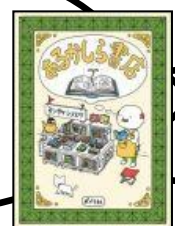
『あるかしら書店』ポプラ社 ヨシタケ シンスケ

※『おきにいりの本の絵を描きました』作品展 もやっているよ。だいすきな本の絵を描こう。