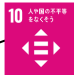
「せかいのひとびと」